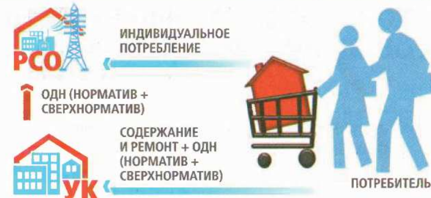
СХЕМА ПЛАТЕЖЕЙ ПРИ НАЛИЧИИ РЕШЕНИЯ СОБСТВЕННИКОВ ОПЛАЧИВАТЬ СВЕРХНОРМАТИВ САМОСТОЯТЕЛЬНО

Если многоквартирным домом управляет управляющая организация, а собственники приняли решение об оплате сверхнормативного объема ОДН за счет собственных средств и есть протокол общего собрания, в котором зафиксировано данное решение, то расчет платы за ОДН ведется в квитанции управляющей организации. Плата за ОДН по нормативу входит в строку «содержание жилья», плата за сверхнормативный объем показывается отдельной строкой. В квитанциях ресурсоснабжающей организации собственникам предъявляется только индивидуальное потребление.